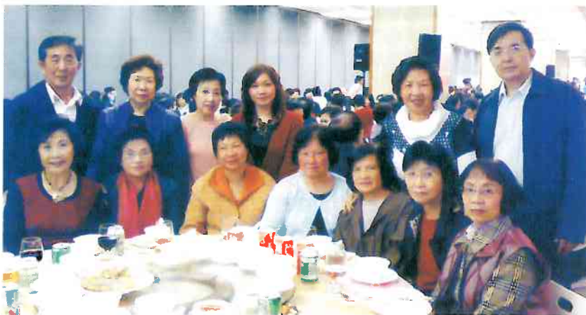
華大香港校友參加福建社團聯會慶祝「三八」婦女節暨慶祝香港回歸十周年聯歡會