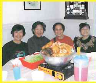
香港人過新年吃盆菜，盆菜是上圍村的發明。校友們正在品嚐地道的圍村盆菜宴。