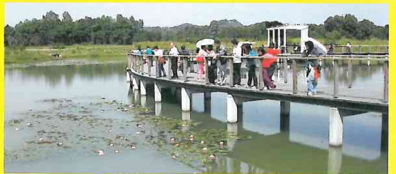
大家投身大自然、欣賞獨特的景觀，更受到一次生動的生態保育教育