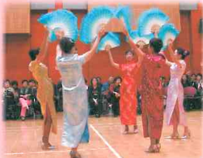
樂之舞學習班」表演了現代舞「夜上海」