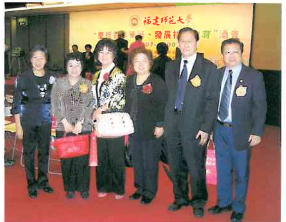
華大香港校友參加福建師大百周年慶祝酒會