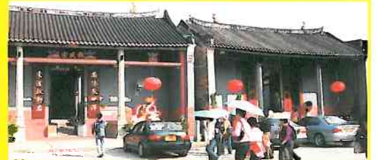
大家沿著坪山文物徑，參觀圍村古蹟