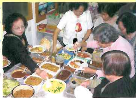
校友烹調的美食擺滿長桌上，共同分享