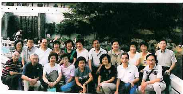
化學系校友歡聚一刻