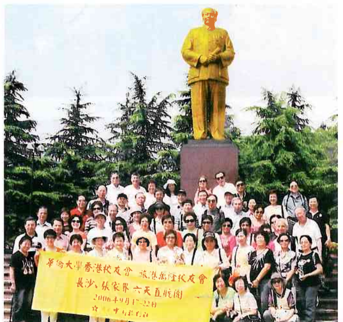
校友在韶山毛澤東同志廣場合影

這次校友旅遊，校友十分融洽，個個精神飽滿，健步健談，雖然年紀比較大，但沒有龍鍾疲態，大家忘記年齡、忘記身份，全心全意投入吃喝玩樂之中。六天之