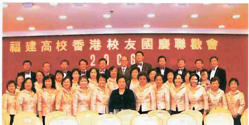
本會合唱團在福建八大院校聯歡會上合照