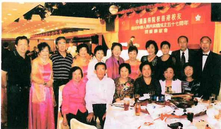
校友參加高校聯國慶聯歡會合影