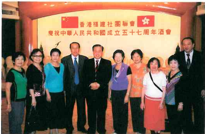
校友參加福建社團聯歡會合影