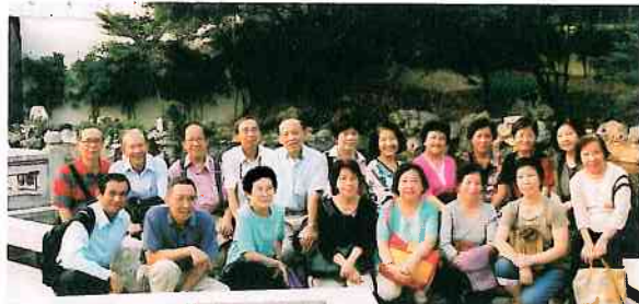
中文系校友難得一聚