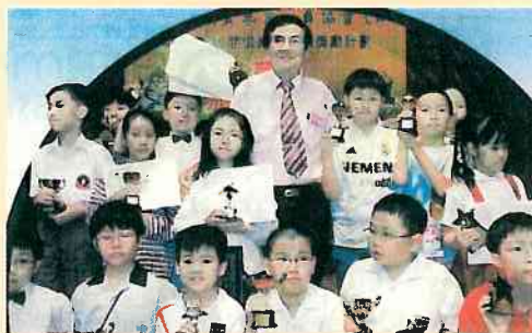
東瑞成為學生最受歡迎的作家