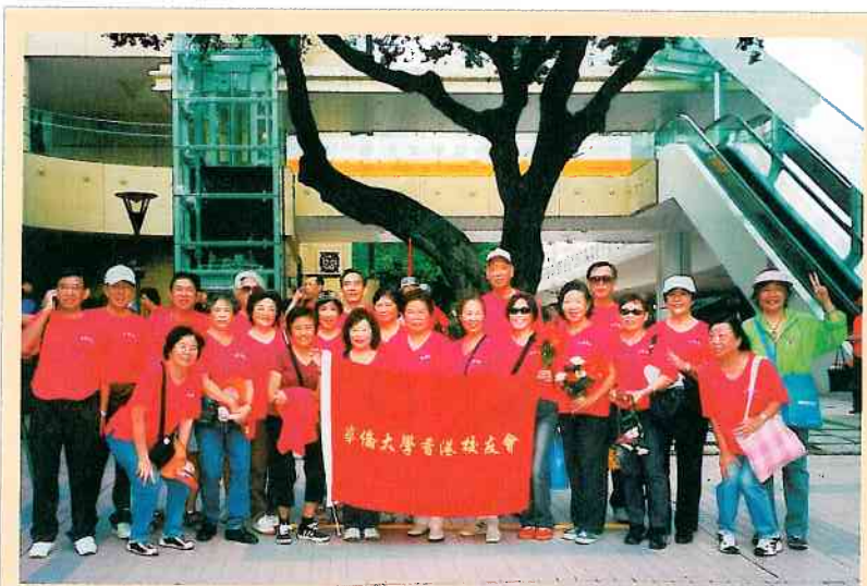
7月1日參加慶回歸大巡遊