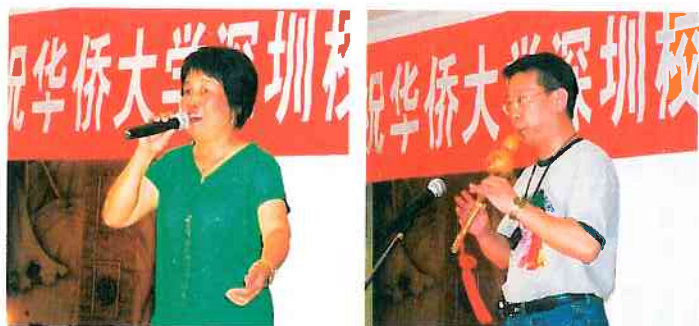
6月18日參加深圳校友會創立20周年的演出