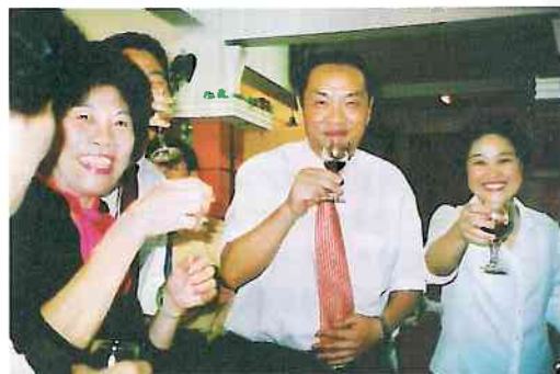
吳校長和朱副校長向校友祝福