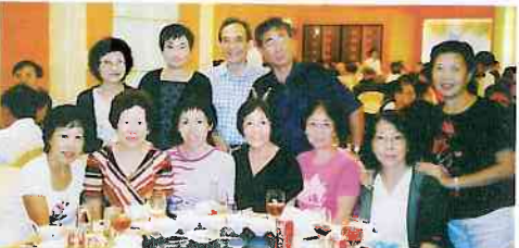
以上四圖為出席福建高校聯歡會的華大校友