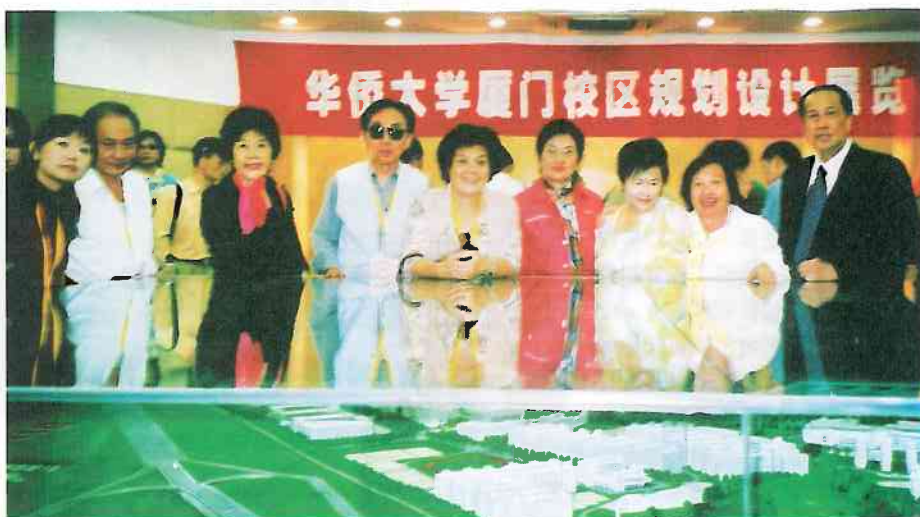
11月2日校友觀看華大廈門校區規劃設計模型展覽