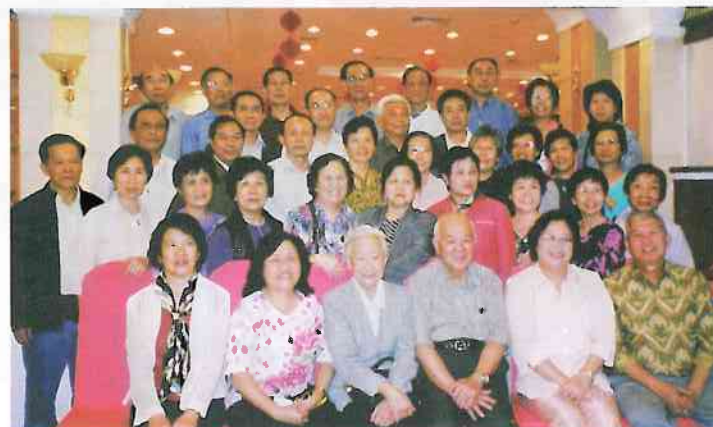
香港外語系校友與內地校友聯歡