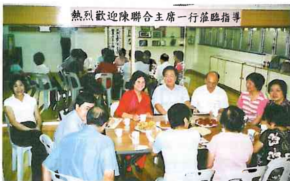
我會熱烈歡迎陳聯合主席一行蒞臨指導