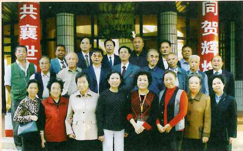
華大政治系 69、70 屆校友泉州聚會

之年的祖父母輩了。同學們的臉譜和體態已今非昔比，然而臉部基本輪廓、說話特徵依然不變，我們 69、70 屆同學過去經常同一大班上課，畢業後有六位同學成了處級領導幹部，許多人成了科級幹部、高級教師……不管職位多高，同學面前一律平等，久別重逢格外激動，笑聲及呼叫聲此起彼伏。