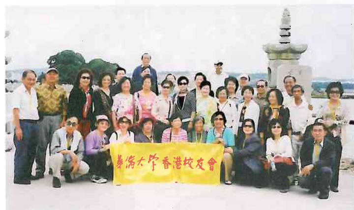
慶賀團11月2日參觀泉州洛陽橋