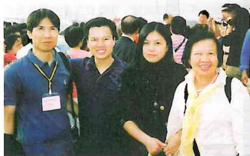
11月2日回母校的年輕校友亦到廈門校區參觀