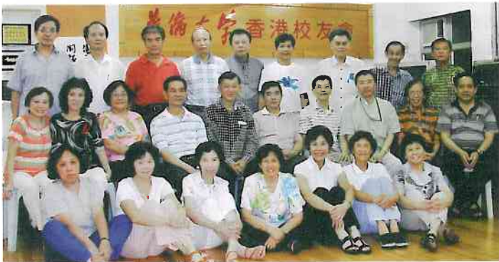
政治系校友聯歡並選出新一屆系校友會負責人。

七月廿四日晚上，政治系在港的校友在校友會會所歡聚。大家一面品嚐着可口的中餚、西菜，還有久違了的南洋小吃，一面談笑風生，粵語、國語，還有印尼話交錯交談。這一邊在圍觀小孫子的玉照，那一邊在談保健心得……。在酷熱的季節，大家在這裡共度一個融洽、親切、涼快的夏夜。