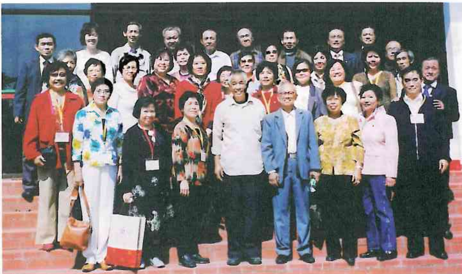
回校慶賀團一群校友參觀校園時在食堂前合照