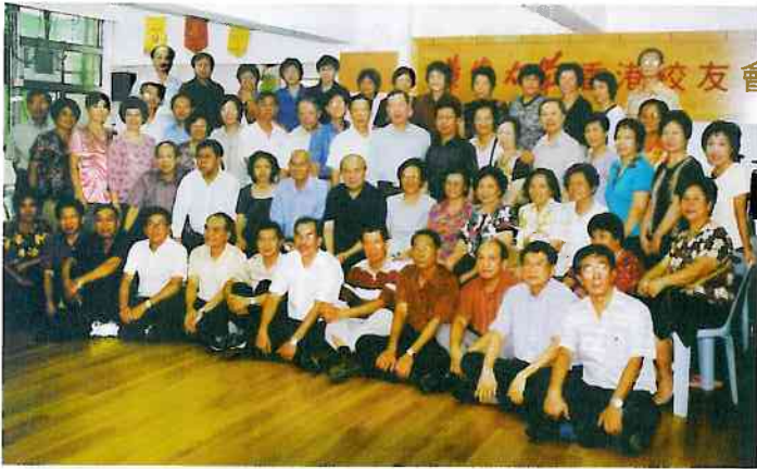
化五同學在華大校友會會所歡聚一堂

金秋十月，正當全國人民以滿懷喜悅的心情迎接偉大祖國五十六周年國慶之際，化五同學從祖國的四面八方，從遙遠的異國他鄉來到香港，參加第二次同學聚會。