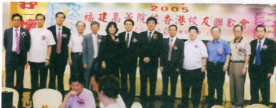
在主席台上的福建高校八大香港校友會會長與嘉賓合照

今年福建高等院校香港校友會聯歡會八月八日在北角新都會酒樓舉行。統籌主辦聯歡會的福建師範大學香港校友與華僑大學、福州大學、福建農林大學、廈門大學、集美大學、福建醫科大學、福建中醫學院八大院校香港校友參加了聯歡會。六百多位與會賓主載歌載舞歌頌祖國，弘揚展示了團結奮發，共建和諧社會的共識和歡樂氣氛，我會共有六、七十人參加。