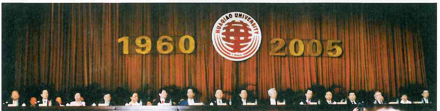
華僑大學舉行隆重慶祝建校45周年大會，圖為就座在主席台上的國家和學校領導人以及校董等。上圖為慶祝大會會場。

海內外人士捐助母校辦學儀式和國務院僑辦與福建省、泉州市共建華僑大學協議書簽字儀式當日上午同時舉行。 ◆ 宣傳部