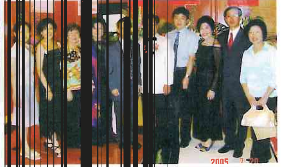
會7月20日舉行的舞會，與該會負責人合影