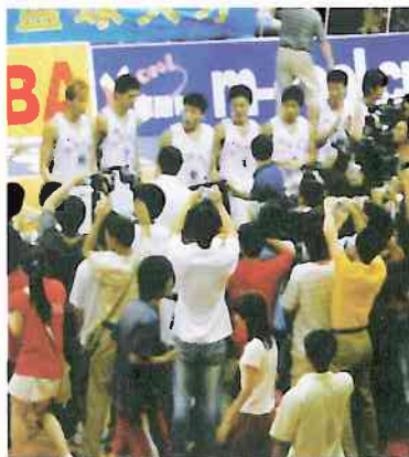
數十名記者蜂湧而上，爭向球員拍攝