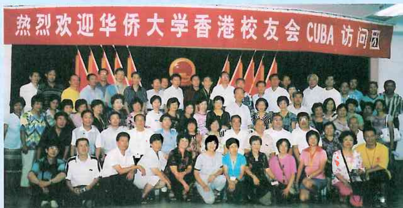
四地校友在泉州座談會上大合照。