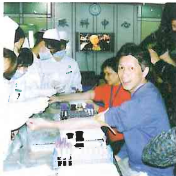
在廣州長安醫院抽血體檢