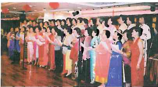
晚會由穿著民族服裝的合唱團演唱歌曲，大受觀眾歡迎