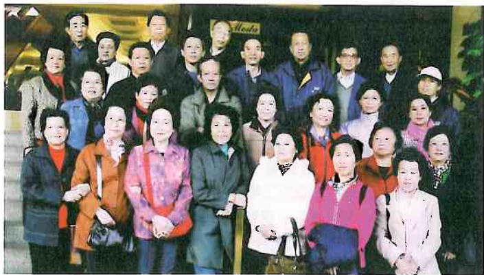
去體檢出發前合照