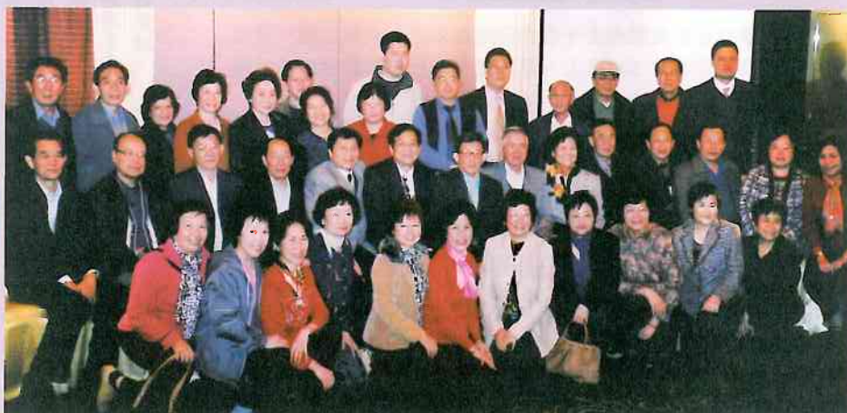
名譽會長與理監事合照