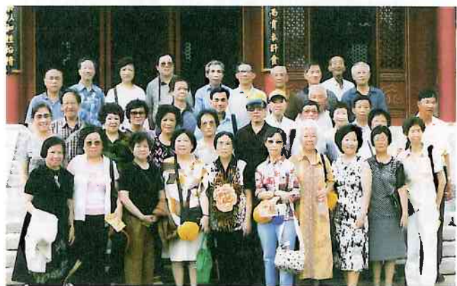
在珠海圓明新園內遊玩合照