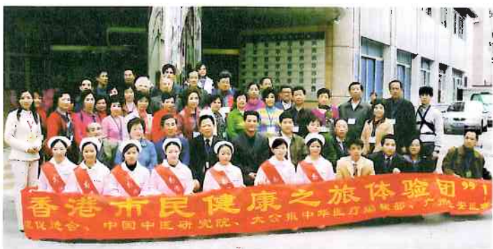
校友在長安醫院門口與醫院領導和醫務人員合照

的積極治療，讓身體早日康復，健康的也要防重於治，鍛煉身體，控制飲食。雖然是知其易，行其難，但為人為己也要學會保重身體，唯有這樣，方能為家庭為社會作出更大貢獻，讓自己活得更有意義，更精彩！