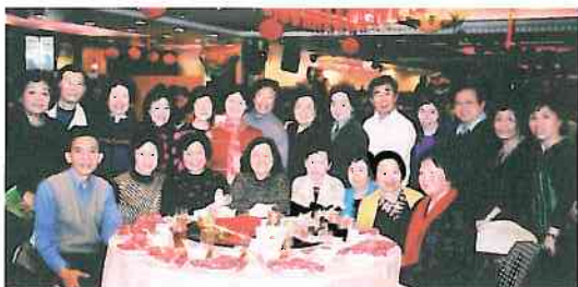
參加晚會的華大校友