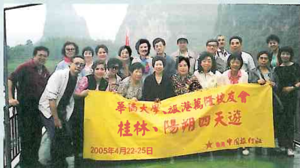
在桂林新景點堯山山頂與美麗的少數民族姑娘合照。