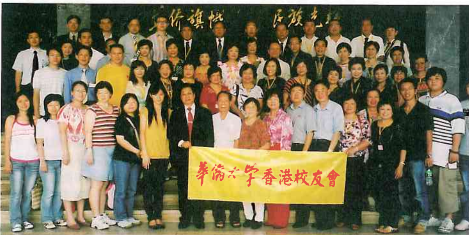
華大香港校友會 CUBA 訪問團在母校陳嘉庚紀念堂與校領導及今年應屆畢業的香港學生座談後合影

七月二日李碧葱帶領我會訪問團參加CUBA雕塑落成揭幕儀式，與校長吳承業、校董楊振志、國務院僑辦監察局局長王麗華、華大紀委書記朱琦環合照