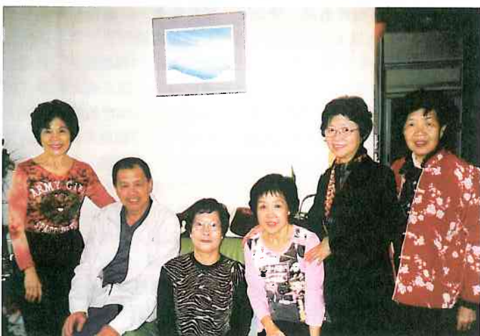
校友會拜訪楊家庭師母（左起第三者）