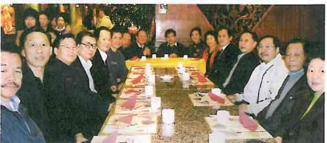
大家排排坐，先照相。