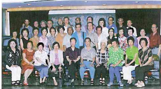
參加珠海聯歡的華大首屆學生