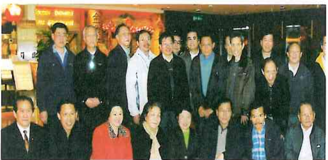
物理系67屆校友在餐廳前合照。