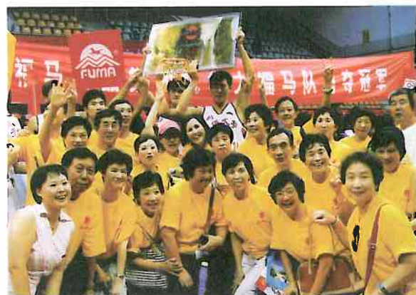
我會訪問團成員穿著啦啦隊服裝向華大男籃隊員祝賀合影