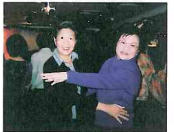
校友齊齊跳、人人歡樂