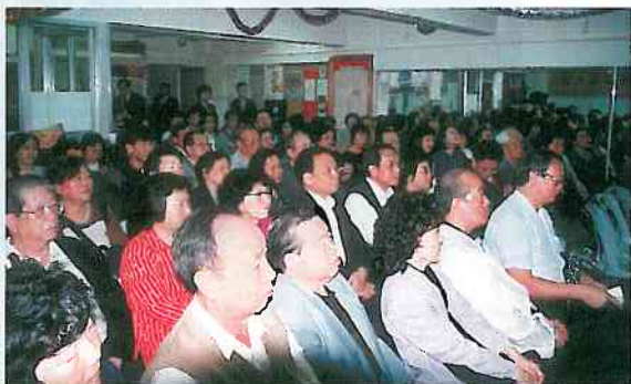
參加報告會的校友在全神貫注地聆聽