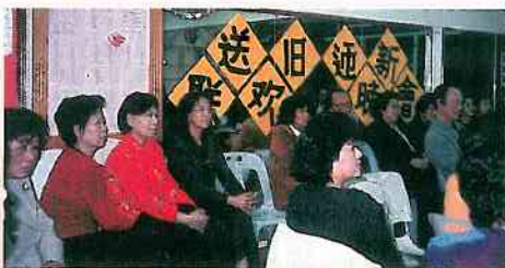
去年十二月三十一日聯歡晚會一角