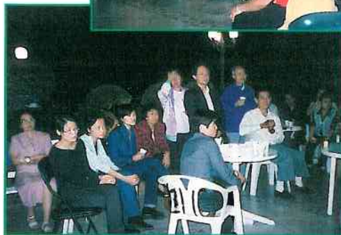
校友在聆聽李先生介紹獅子會情況。