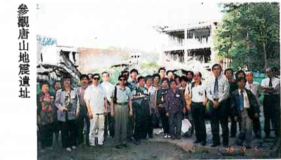
參觀唐山地震遺址