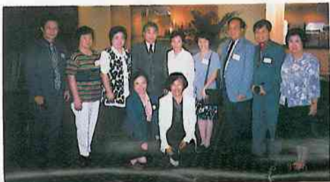
部分華大校友與港澳辦趙秉欣司長合影