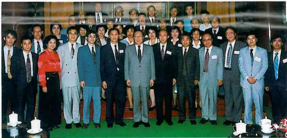
李嵐清副總理接見暨大、華大香港校友會訪京團一行。