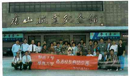
在唐山抗震紀念館前