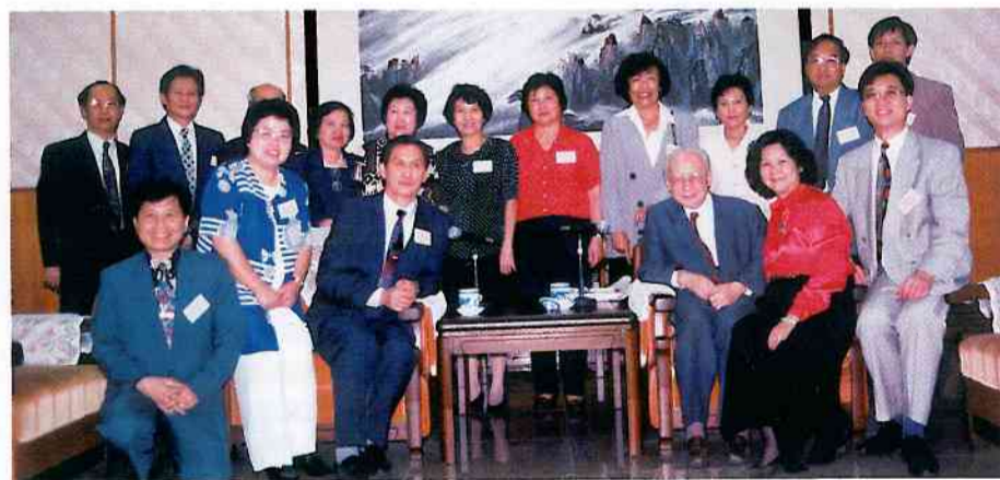
錢偉長副主席與華大香港校友會訪京團合影。