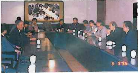
僑聯負責人與訪京團座談