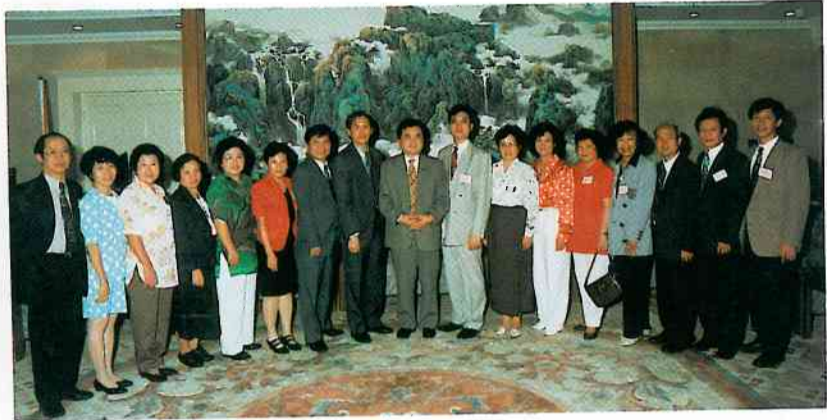
(右)與唐山市市長祝允林合照 (左)在天安門廣場合照