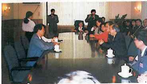
國家教委港澳台辦負責人李海績(左一)介紹教育事業的發展概況