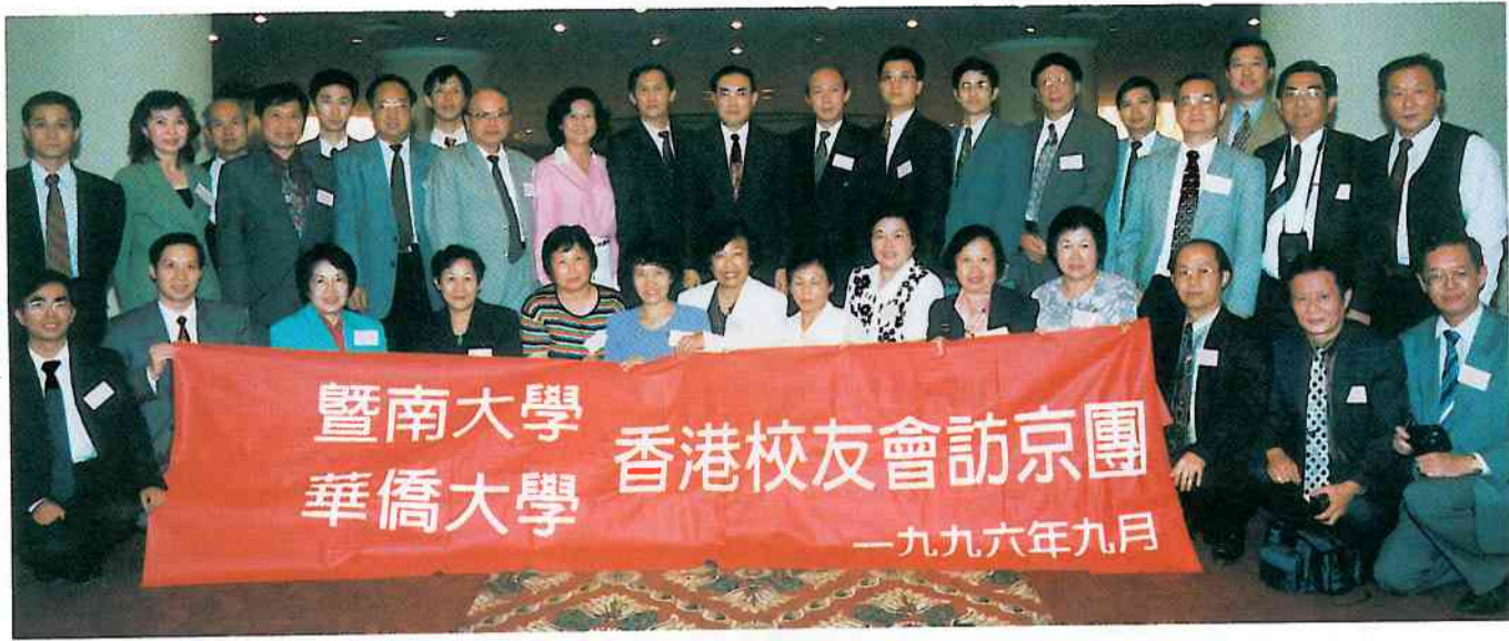
港澳辦副主任王鳳超設宴接待並與兩校訪京團合影