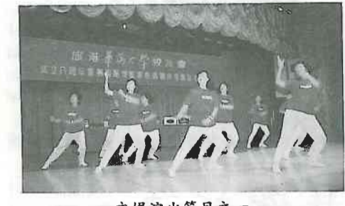
文娛演出節目之一