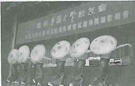
文娛演出節目之四