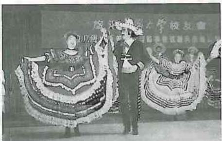
文娛演出節目之三