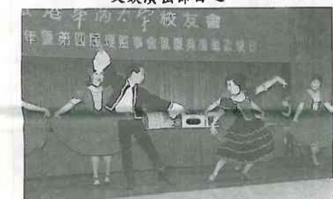
文娛演出節目之二