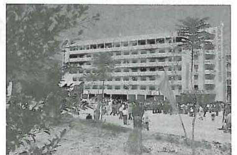
▲華豐國貨公司捐建的「華豐樓」宿舍大樓。