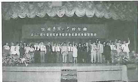
理監事向大家舉杯祝酒