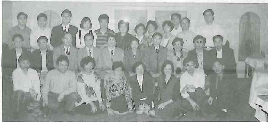
僑辦教育考察團與旅港華大校友合影