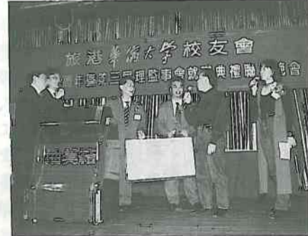
10. 抽到獎品者上台領獎。