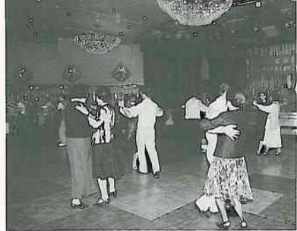
11. 校友們跳起社交舞，舞姿翩翩，搖曳生姿。