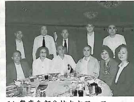
14. 醫療系部分校友亦照一張。