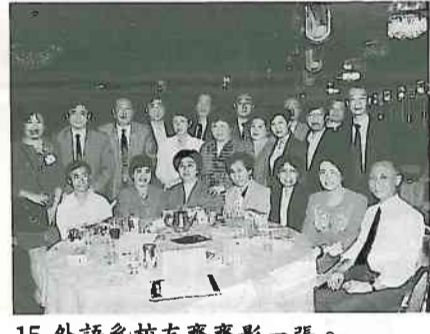
15. 外語系校友齊齊影一張。