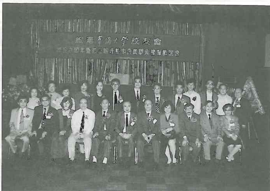
旅港華僑大學校友會第三屆理監事會四月三日就職合影

通訊地址：香港皇后大道西2-12號 聯發商業中心2203-4室 ROOM 2203-4, ARION COMMERCIAL CENTRE, 2-12 QUEEN'S ROAD WEST, HONG KONG