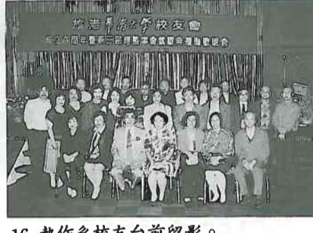
16. 熱作系校友台前留影。