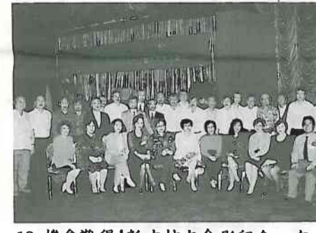
13. 機會難得！新老校友合影留念，有不少是土建系校友。