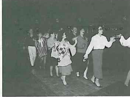
12. 來吧，大家來跳集體舞！